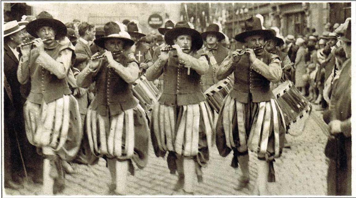
LA FÊTE DES VIGNERONS DE 1927 : LA PUBLICATION DE LA FÊTE Les Fifres et les Tambours de Bâle, en costumes de Cent-Suisses.