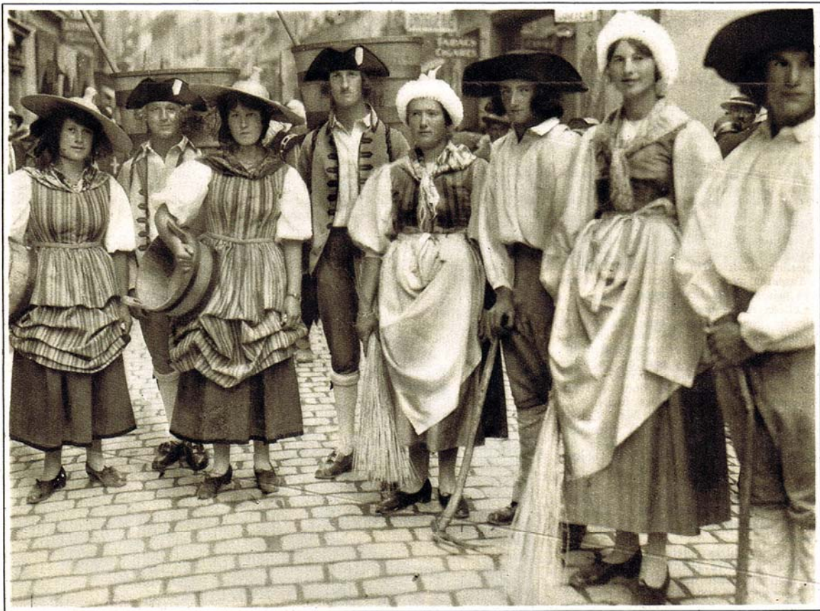
LA FÊTE DES VIGNERONS DE 1927 : LA PUBLICATION DE LA FÊTE Les vigneron du Printemps et de l'Automne: Savoyardes en coiffe blanche, faisant les effeuilles et portant leur „paille de lève“; Vignerons avec leurs fossiers; Vendangeuses en costume vaudois et Brantards.